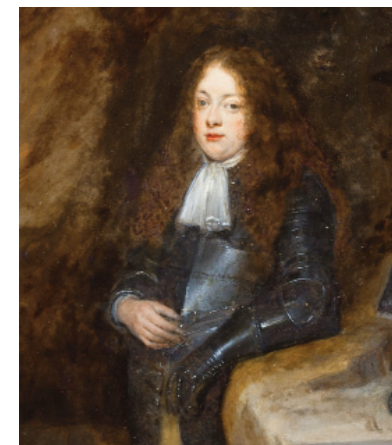
Gerard ter Borch, Portrait of a man in armour (prince Cosimo de' Medici) ca. 1670 Deventer Collectie, Vereniging de Waag